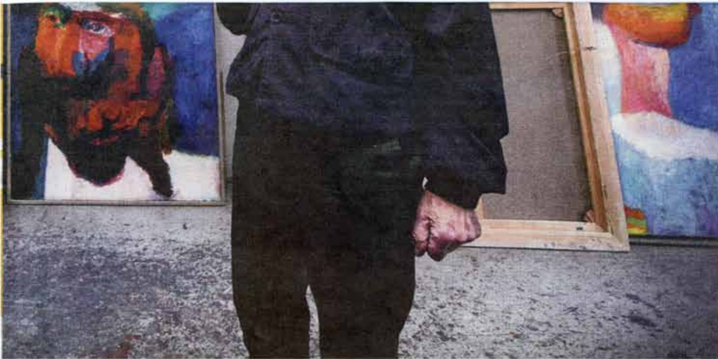
plaats, de juiste kleur.'

heb. Sommigen geloofden dat het wel los zou lopen met die Duitsers."