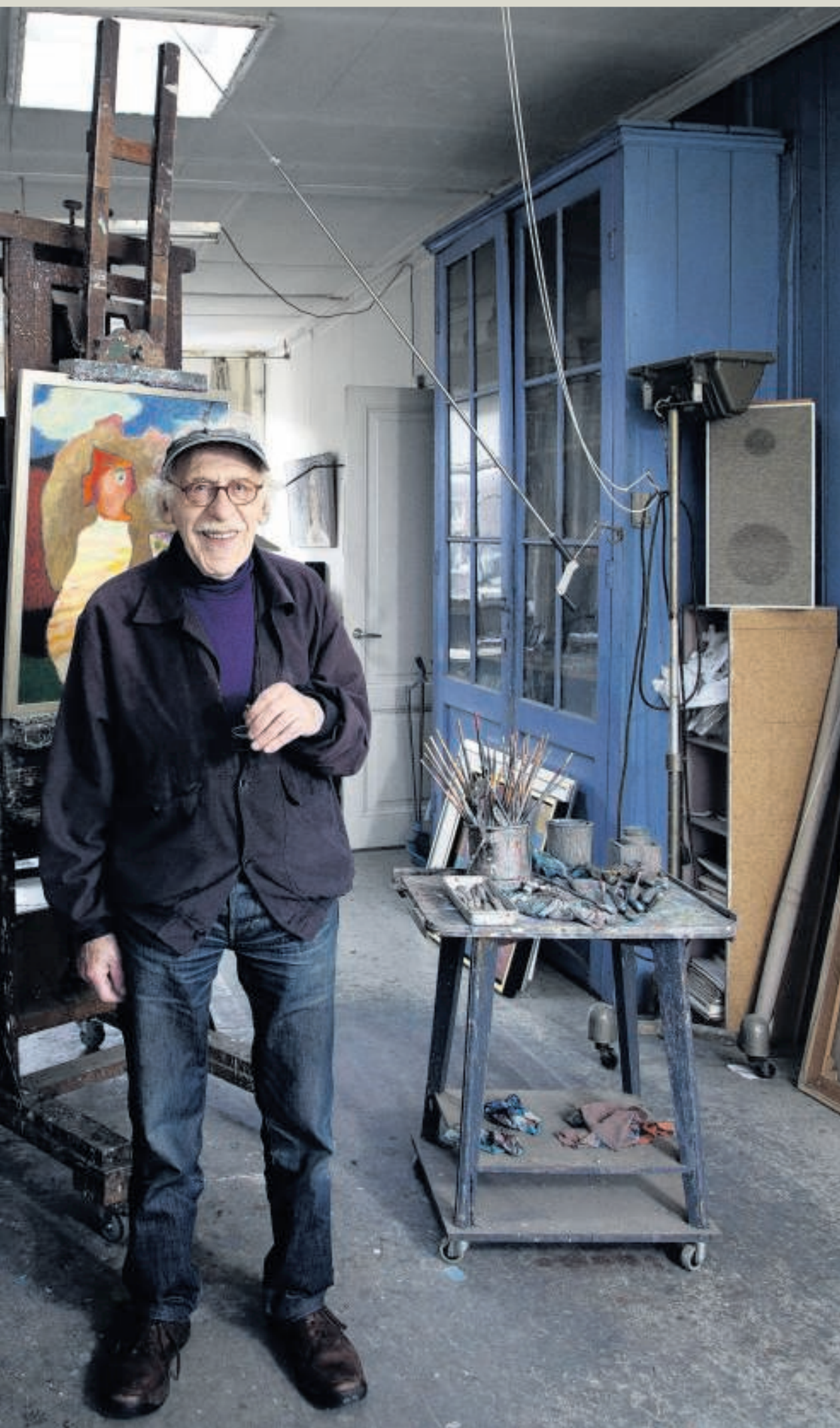
'Mijn vrouw en ik spraken na de oorlog af dat we geen slachtoffers wilden zijn. Dat is gelukt.'

vrouwenfiguren in het landschap. Nooit hebben ze scherpe gelaatstreken. Ook in de woonkamer hangt zo'n schilderij. Het is alsof de schilder alle moeite heeft gedaan om de vertrouwde contouren van zijn overleden dochter weer op het netvlies te krijgen – maar haar beeld toch nooit meer scherp heeft kunnen krijgen.